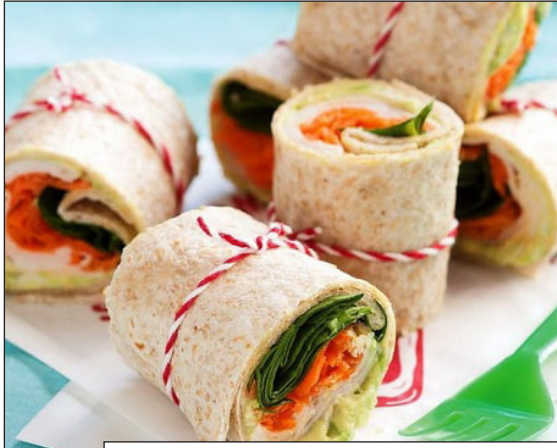
Рол з лавашем, овочами та куркою

Проаналізуй зображені страви. Обери серед них ту, що найбільше підходить тобі для харчування поза домівкою. Поясни свій вибір.