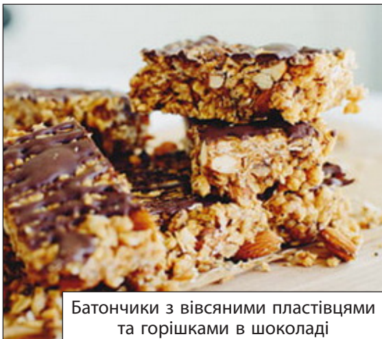
Батончики з вівсяними пластівцями та горішками в шоколаді