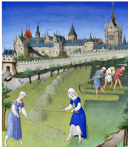
Брати Лінбурги. Сінокіс. Мініатюра. 1416 р.

Мініатюра з книги Арістотеля «Етика, політика, економіка». XV ст.