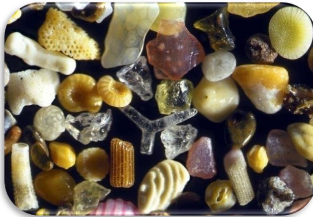
Пісок під мікроскопом

ПІСОК — один з найпоширеніших ресурсів нашої планети. Він утворився з осадових гірських порід, які впродовж мільйонів років подрібнювалися під впливом вітру, води і сонця. Діаметр піщинок від 0,05 мм до 2,5 мм. Піщинки — це фрагменти розмитих гірських порід, виверження вулканів, мертвих організмів і навіть рукотворних зруйнованих об'єктів.