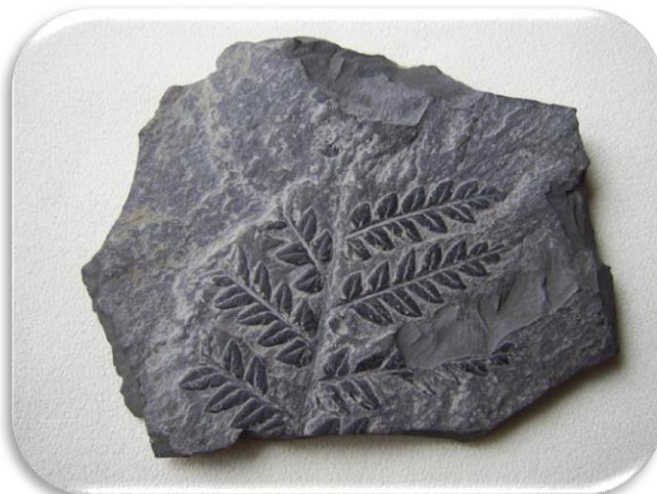
Відбиток давніх рослин на вугіллі

Крейда і мрамур — різновиди вапняку. Мрамур створений під дуже великим тиском води. З нього створюють скульптури, ошатну плитку, облицювання для будівель. Крейда — це різновид вапняку, що складається із зцементованої маси мікроскопічних морських тварин та вапнякових планктонних водоростей.