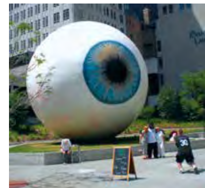
Величезна скульптура у вигляді ока заввишки з триповерховий будинок у Чикаго

Найдосконаліший фотооб'єктив змінює фокус впродовж 1,5 с, а кришталік ока змінює фокус перманентно і несвідомо. Впродовж секунди кришталік фокусується на 50 предметах.