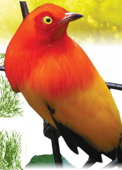
Червоношапковий золотий альтаночник ( Sericulus bakeri )