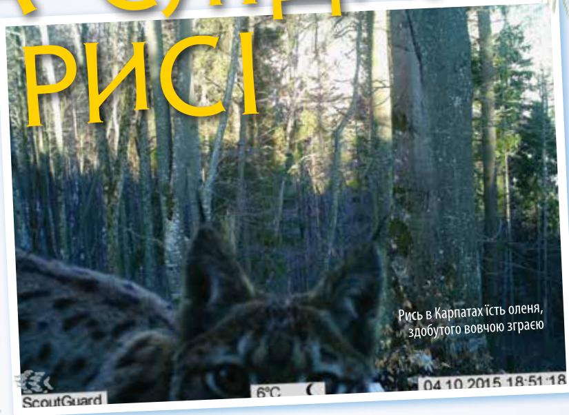
Рись в Карпатах їсть оленя, здобутого вовчою зграєю