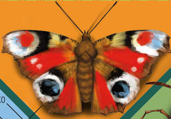
Павичеве око Дереволаз