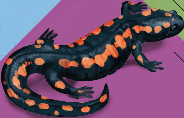
Шершень звичайний Вогняна саламандра