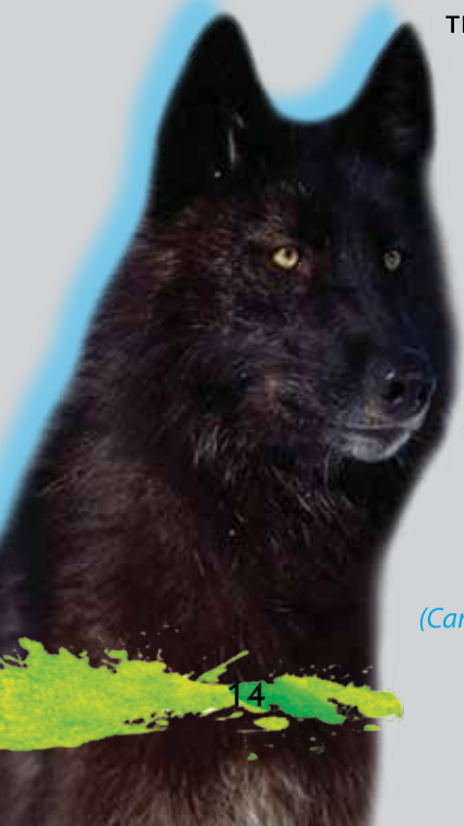
Східний вовк ( Canis lupus lycaon )

Літнє хутро вовка, на відміну від зимового, грубе і жорстке. Переважають рудуваті кольори. Взимку шерсть груба і густа (особливо на шиї), з добре розвинутим підшерстком, який має низьку теплопровідність. Згорнувшись у клубок, хижак може лежати на снігу у сорокаградусний мороз і сильний вітер. Морда звіра вкрита коротшою шерстю, тому вовки прикривають її пухнастим хвостом. Линяють вовки двічі на рік: навесні та восени. Заміна зимового хутра на літнє триває з кінця лютого до травня.