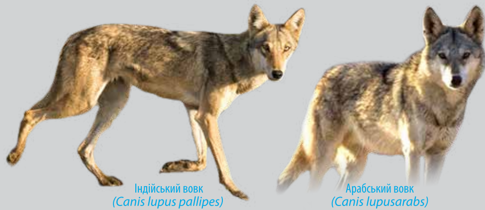
Індійський вовк ( Canis lupus pallipes )