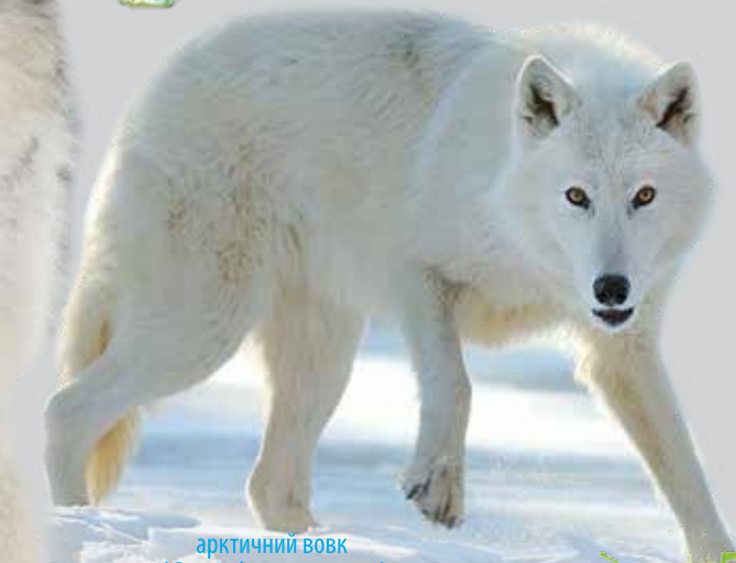
арктичний вовк ( Canis lupus arctos )