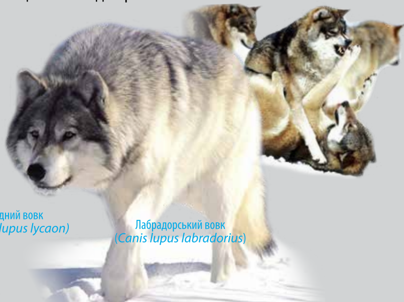
Лабрадорський вовк ( Canis lupus labradorius )