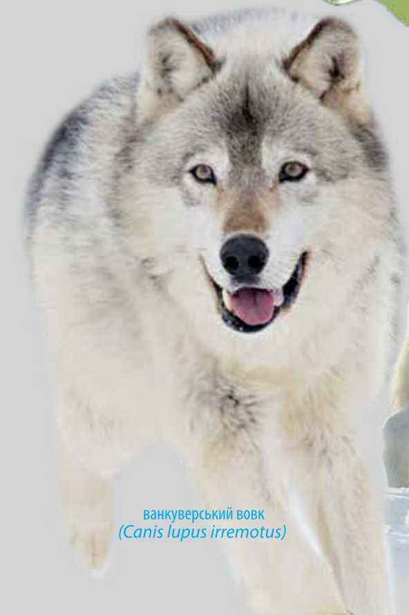
ванкуверський вовк ( Canis lupus irremotus )