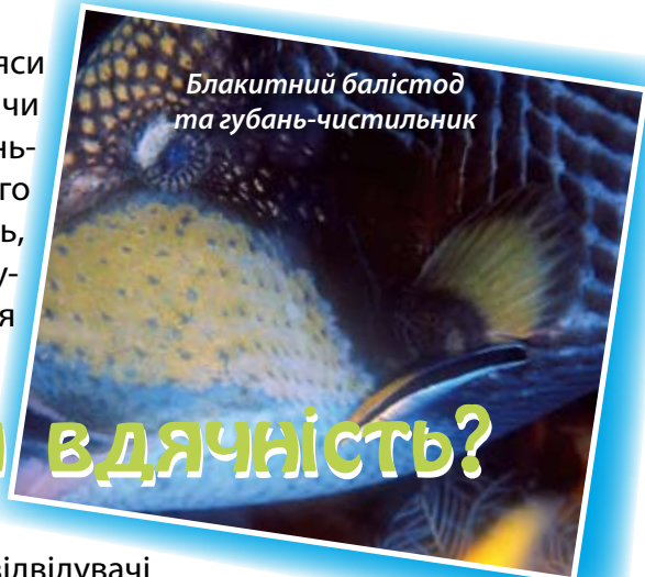
Блакитний балістод та губань-чистильник

тара і починає виробляти перед ним вихляси тілом, піднімає та опускає зяброві кришки чи вказує на необхідність почистити рот. Губань-чистильник – кмітлива рибка, його довго впрошувати не потрібно. Губанів не з’їдять, навіть коли вони працюють у роті хижої мурени, адже пацієнтам ще не раз доведеться до них звертатись.