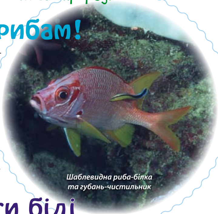
Шаблевидна риба-білка та губань-чистильник