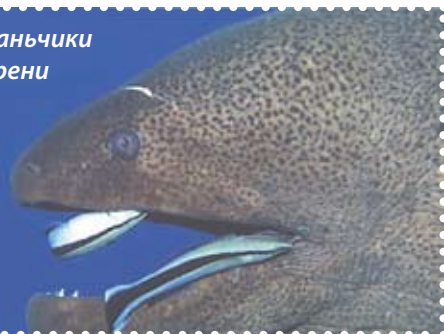
Блакитні губаньчики у пащі мурени

Невеликі жовто-блакитні рибки (див. фото), приваблюють на коралові рифи мешканців далеких вод. Ні, вони не є морськими делікатесами. Вони – губані-чистильники.