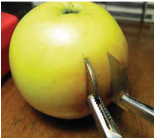
Електроди — монетка та шматок жерсті

Фруктова батарейка. За мал. 33 у підручнику сплануйте дослід. Вам знадобиться мультиметр, два предмети з різних металів, наприклад, мідний дріт і залізний цвях (або ключі чи монети), яблуко (спробуйте і солодке, і кисле), апельсин, цибуля та ін.